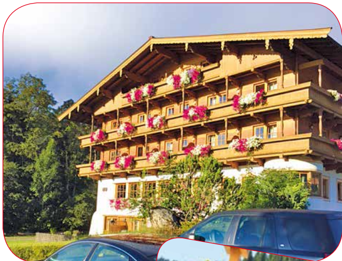
Das Hotel in St.Johann