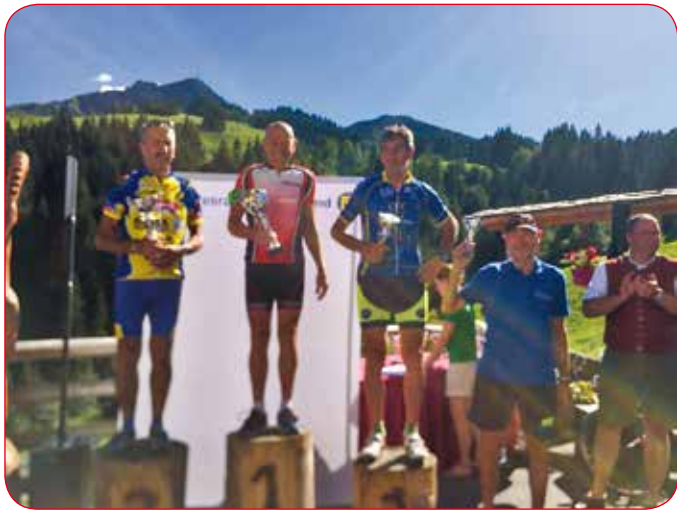
Seniorenn WM St.Johann