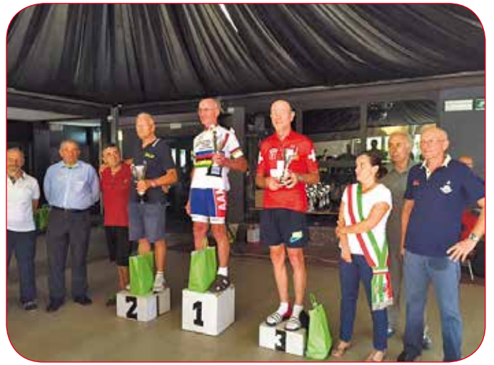
Bäcker WM Parma