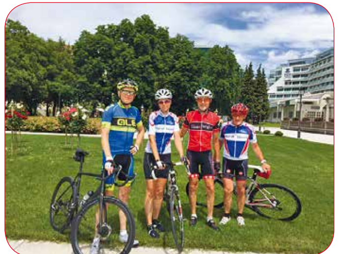
Der Söldner bei der Therme Krka in Slowenien